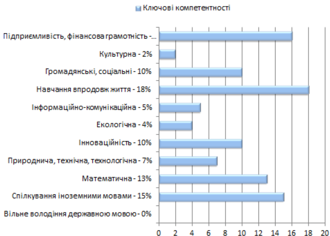
Діаграма. «Проблемні» ключові компетентності на уроці української мови

Сучасні підручники української мови для 5 класу [2], [6], [8] за вказаною модельною навчальною програмою ґрунтуються на компетентнісно-діяльнісному підході до навчання державної мови. Наведемо приклади оригінальних вправ/завдань, спрямованих на розвиток «проблемних» ключових компетентностей.