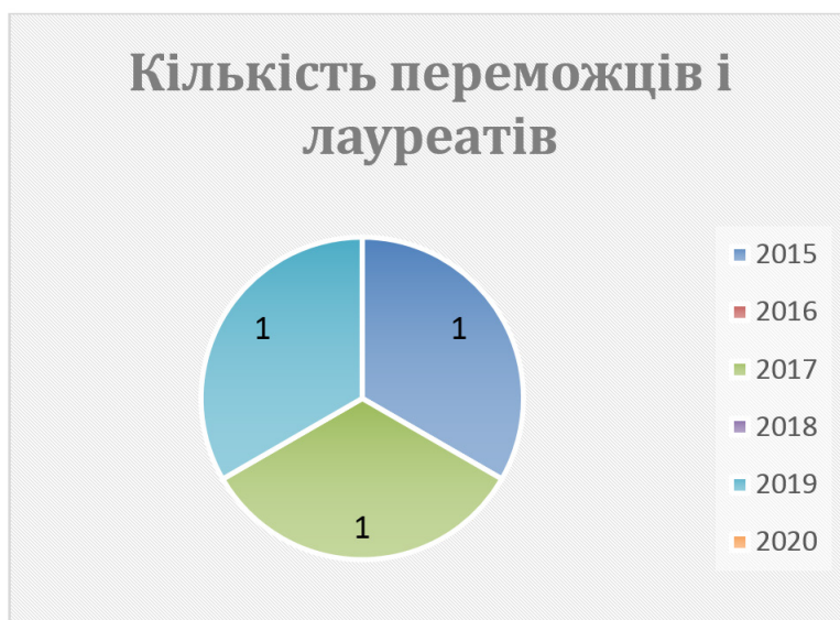
Рис 1. Кількість переможців і лауреатів за 5 років

За час існування професійного конкурсу Миколаївська область має 4 абсолютних переможці та 24 лауреати заключного етапу всеукраїнського конкурсу «Учитель року».