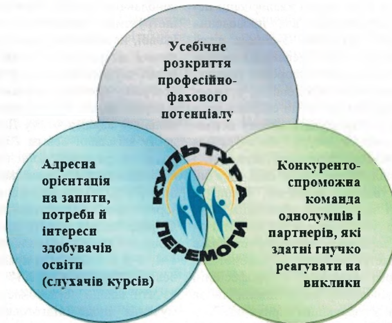
Рис. 1. Модель «Стратегія культури перемоги»

Кінцева мета співпраці суб'єктів освіти взагалі та здобувачів освіти (слухачів) зокрема: подальше зростання нашої конкурентоспроможності як інституції післядипломної педагогічної освіти та постійне виховання культури переможців у кожного.