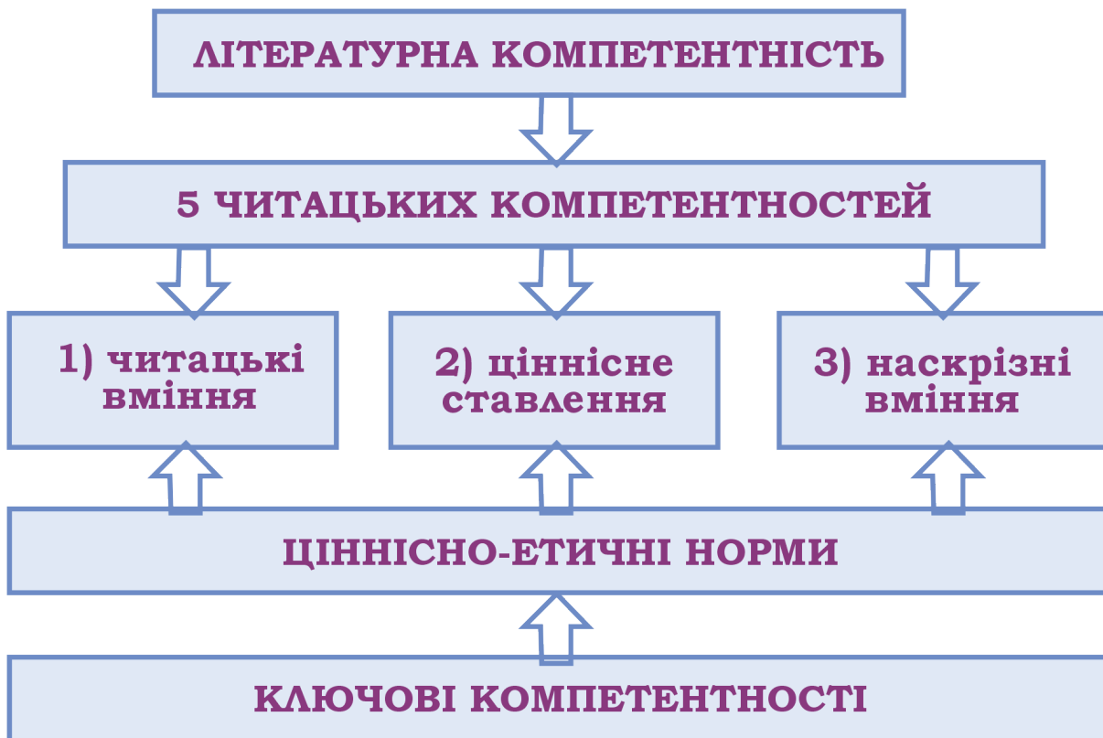
Рис. 1. Архітектура літературної компетентності