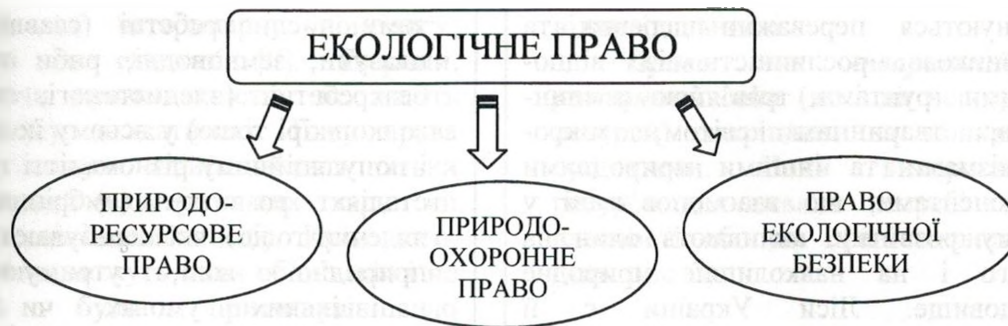
Рис. 1. Система екологічного права

Природоресурсове право як юридичний аспект біологічної та екологічної освіти. Природоресурсове право визначає можливості та межі використання окремих природних ресурсів – землі, вод, надр, атмосферного повітря, тваринного світу (фауни) і рослинного світу (флори). Кожен із них регулюється окремими законодавчими актами. Відповідно, природоресурсове право включає земельне, гірниче (надрове), лісове, водне, фауністичне, атмосферне право.