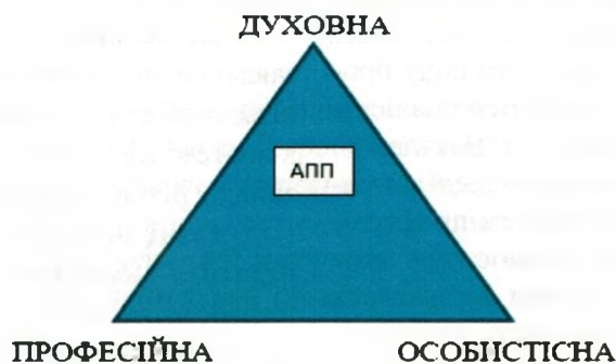
Рис. 2. Акмеологічна модель педагога

Засновницею шкільної акмеології є професор В. М. Максимова. Шкільна акмеологія вивчає вершини розвитку суб'єктів освітнього процесу школи ( педагогів та здобувачів освіти ). Для педагогів – це професіоналізм і компетентність, для здобувачів освіти – розвиток самоорганізованої особистості.