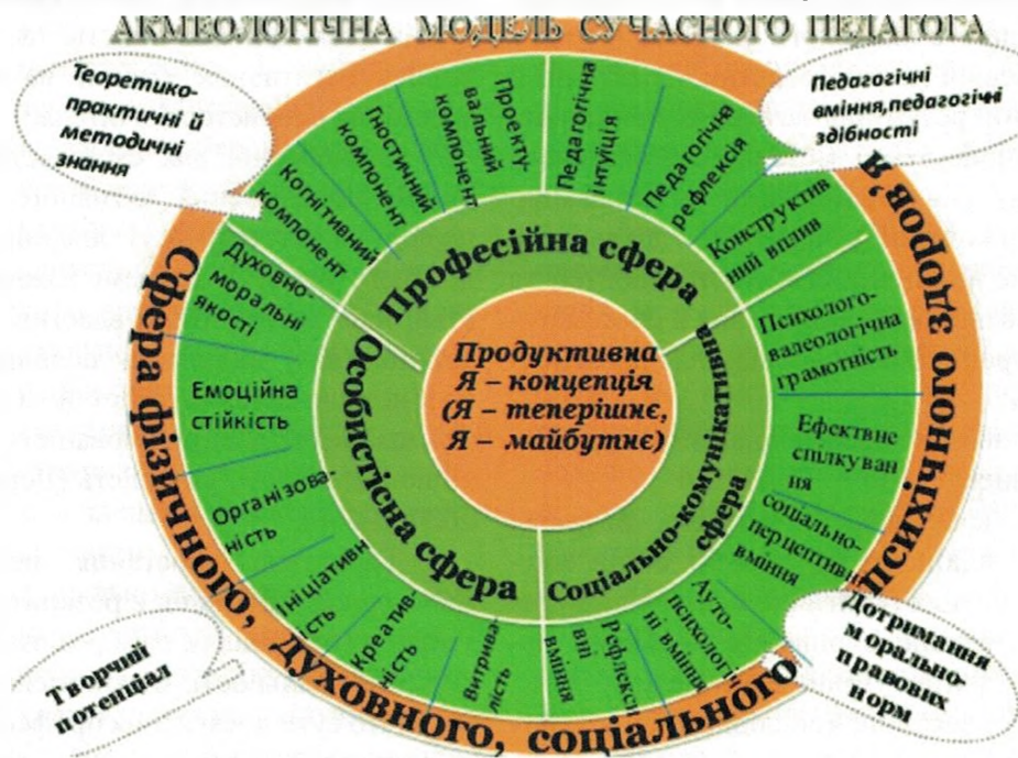
Рис. 4. Акмеологічна модель сучасного педагога

Проведене дослідження дає змогу обґрунтувати орієнтовну структуру акмеологічної моделі сучасного педагога в умовах післядипломної освіти для підвищення якості освітнього процесу сучасної школи.