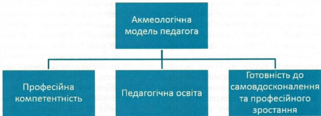
Рис. 3. Акмеологічна модель сучасного педагога

акмеологічна модель сучасного педагога має три складові: